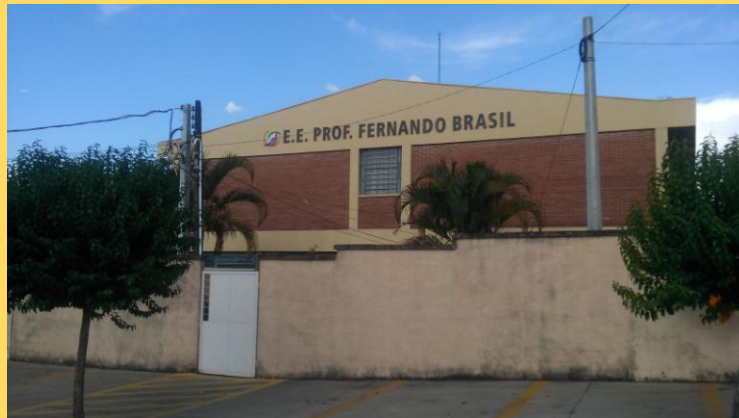
Instalações atuais da Unidade Escolar.