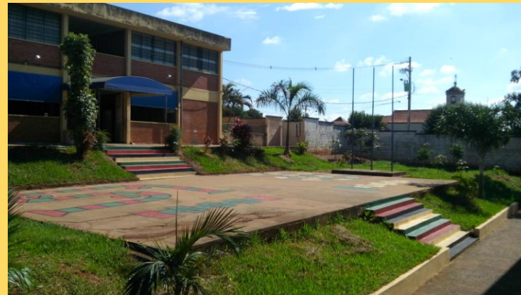
Instalações atuais da Unidade Escolar