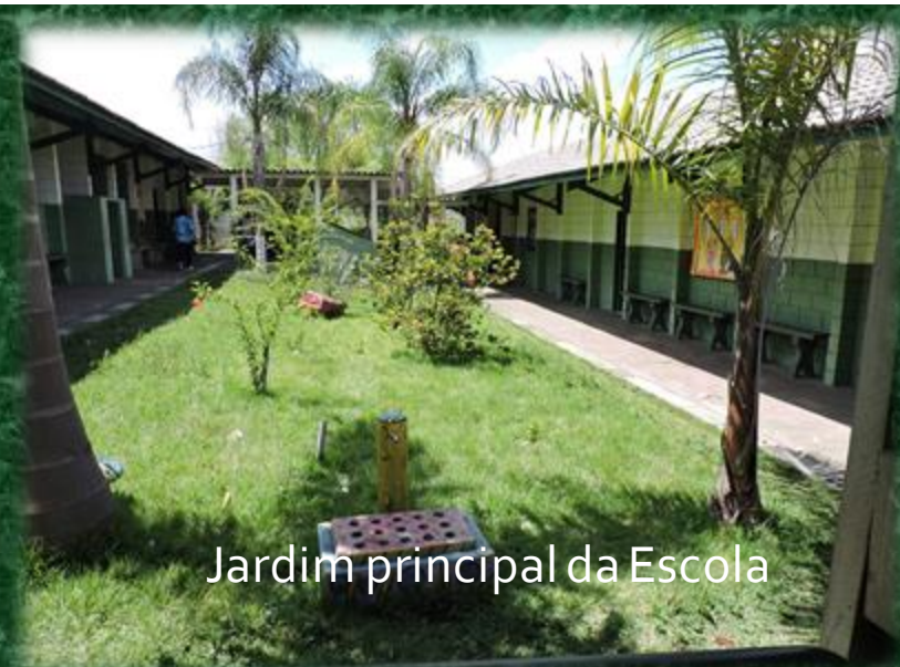
Jardim principal da Escola